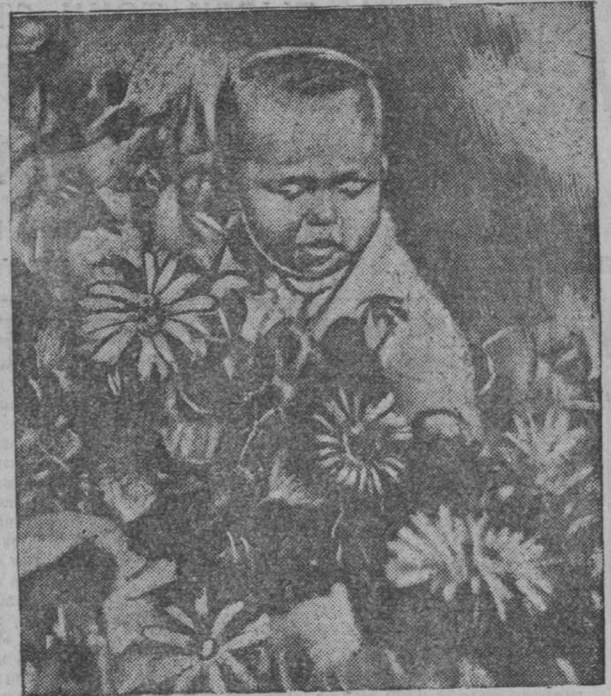
ОСЕНЬ В САДУ.

«В связи с великодушным завершением кругового полета из Красноярска в Москву, прошу Вас передать мои горячие поздравления пилоту Молокову, первому механику Побежимо-ву, штурману Рителанду и второму механику Мишенкову, замечательный рейс которых с очевидностью показал ценность материального оборудования и мастерство экипажа.»