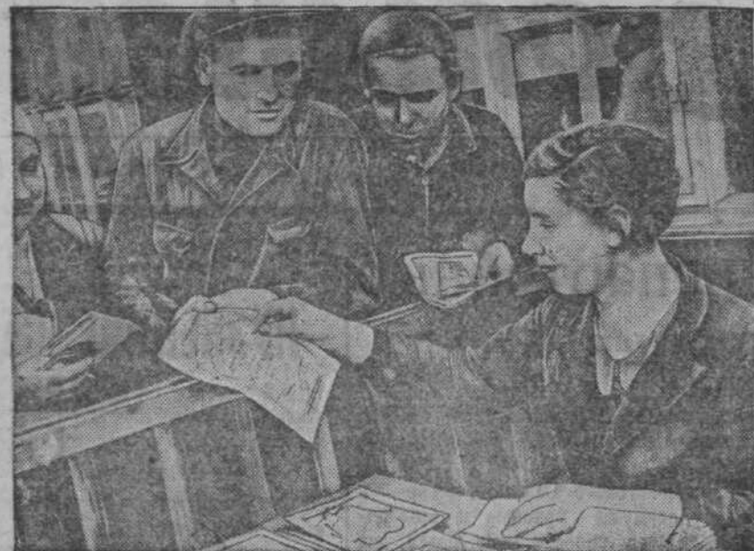
1 сентября в Москве, Ленинграде, Киеве и Минске начался обмен облигаций. В первый же день в Москве приступили к работе сотни обменных пунктов. На снимке: обмен облигаций в литейном цехе завода «Борец».

разлагают дисциплину в колхозе. Подготовленный к сдаче государству хлеб они отказались нести на пункт