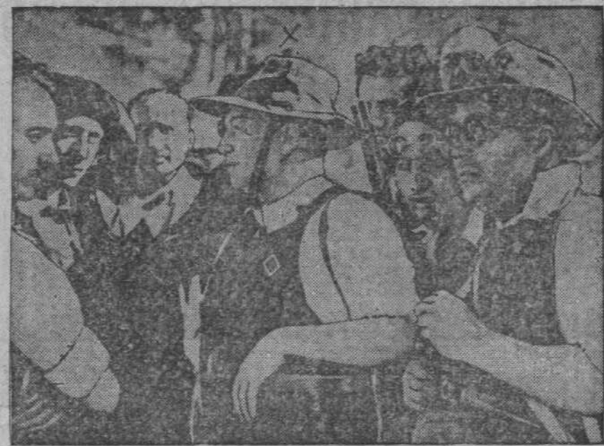
К военно-фашистскому мятежу в Испании. На снимке: лидер левого крыла испанской социалистической партии Ларго Кабальеро (помечен крестиком) обсуждает с отрядом рабочей милиции план боевых действий против мятежников на северном фронте. В настоящее время Ларго Кабальеро — глава испанского правительства.