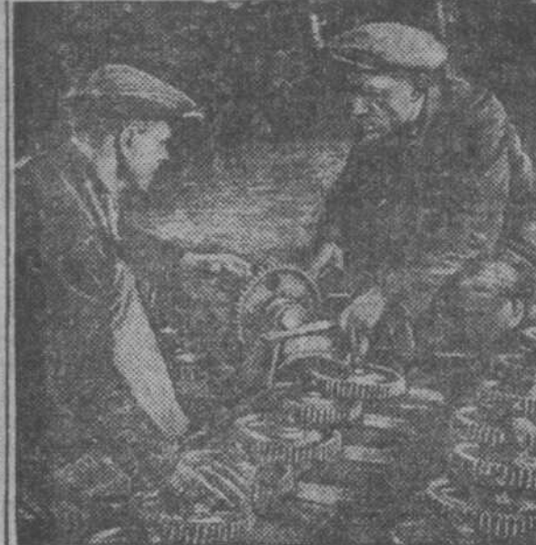
Сибмашстрой освоил изготовление сложных льнотрепальных машин. Выпуск льнотрепальных машин благодаря стахановским методам работы перевыполняется. Вместо 2-х машин завод выпустит 6-8 машин.

22 июня с конвейера завода «Коммунар» (Залоржье) сошел сорокатысячный комбайн. За первое полугодие 1936 г. «Коммунар» дал свыше 12 тысяч комбайнов, тогда как за 6 предыдущих лет завод вывучил всего 28 тысяч комбайнов. (ТАСС).