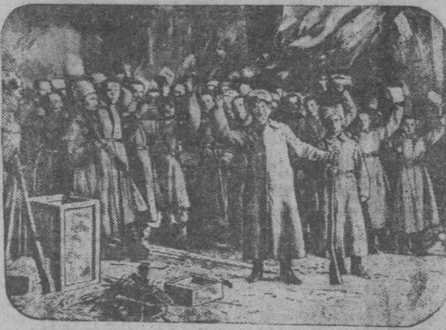
Опера «Тихий Дон». Сцена из 5-го акта. Встрание солдат с казаками.

На общезаводской конференции будут премированы отличники учебы, лучшие культурмейцы, преподаватели цехпрофгорт.