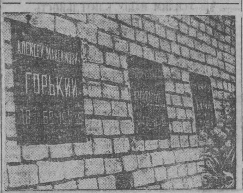
Рядом с прахом тт. Кирова и Куйбышева в Кремлевской стене замурован прах А. М. Горького. На снимке: мемориальная доска на Кремлевской стене, где замурован прах А. М. Горького.

благоговение перед высшим божественным существом и поэтому все дальнейшие выступления проповедей «благодетельства» являются уголовно наказуемыми. Смысл этого параграфа сводится к искоренению малейшей пропаганды атеизма и иных проявлений «вольномудельства». (ТАСС).