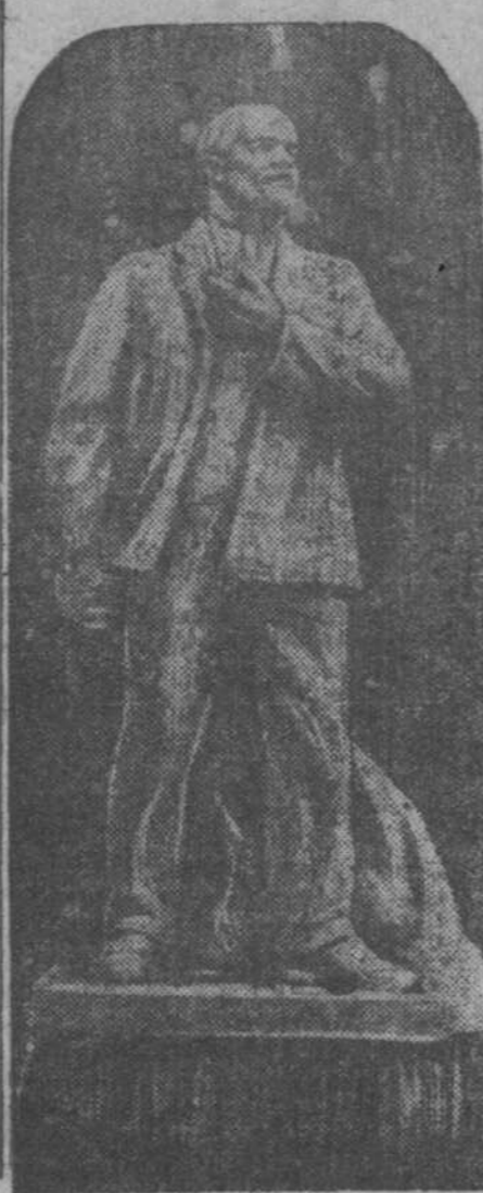
Музей В. И. Ленина в Москве. На снимке: скульптура работы Меркурова «В. И. Ленина» в Большом концертном зале музея.

Толкомандир производства, тот профорг или парторг, который не берет работы у себя ударников, но по-