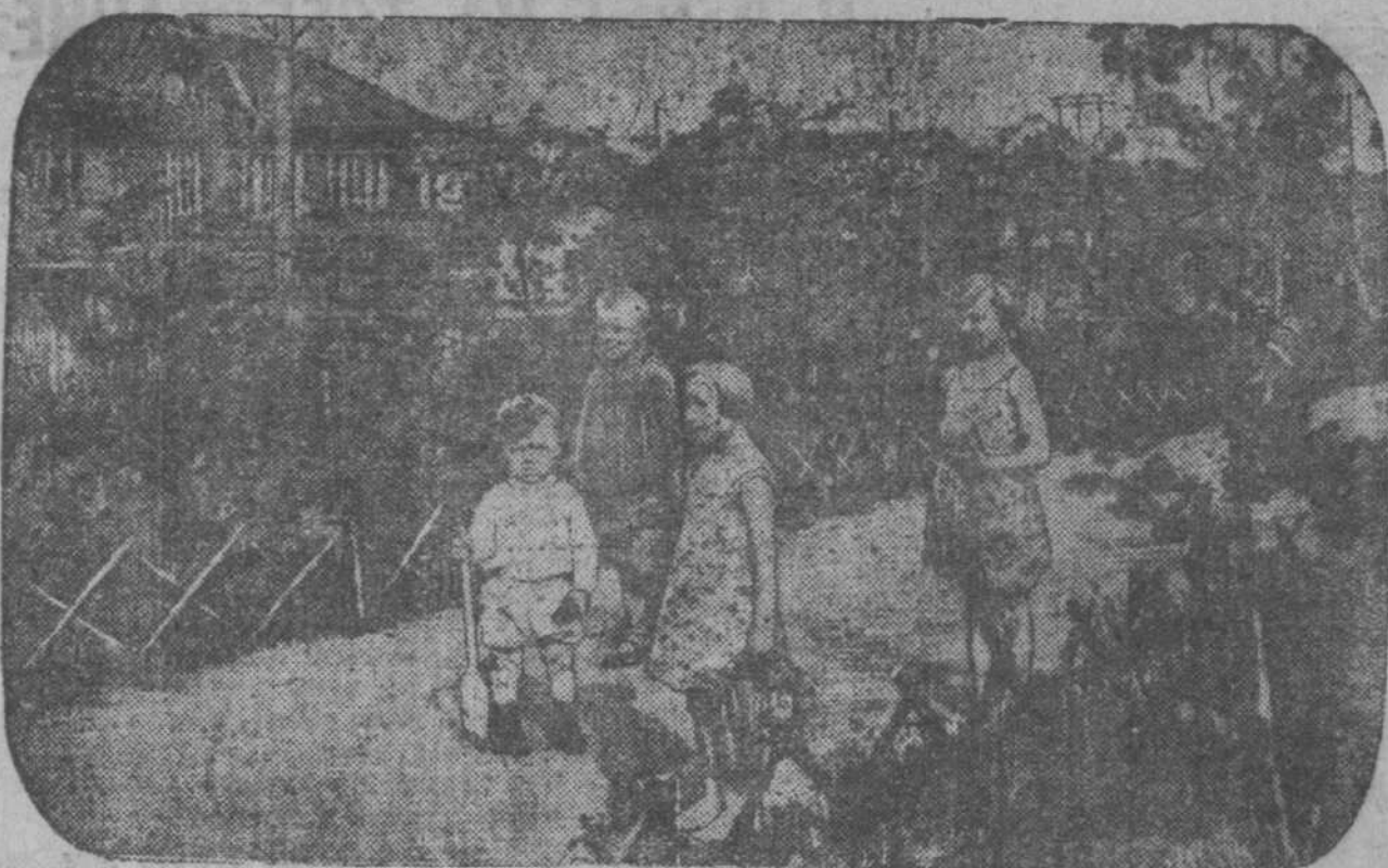
Утро на Верхней колонии. Дети на прогулке.

Анализируя международное положение, Броудер заявил, что в настоящее время мир разделен на два лагеря — лагерь мира и прогресса, цитаделью которого является Советский Союз, и лагерь реакции, наиболее крупным представителем которого является фашистская Германия. Проект новой Конституции СССР — демонстрация величия дости-