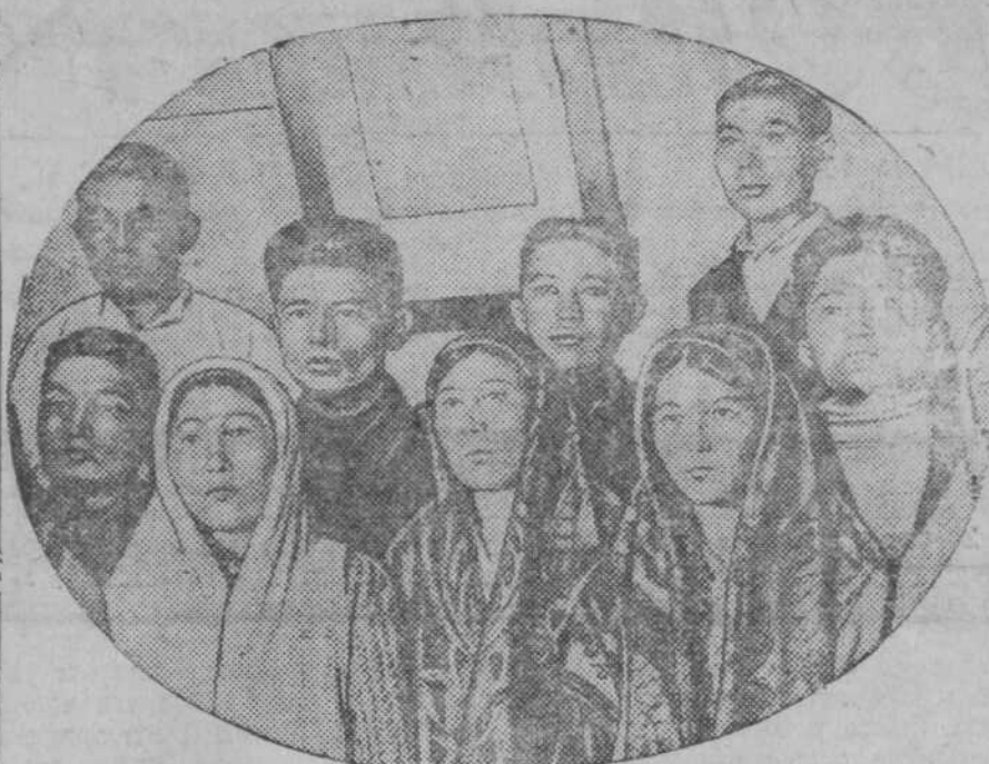
Самодельный хор и драматический кружок клуба нацменов Сталинска усиленно готовятся к нацменовскому празднику „Сабан-Туй“. На снимке: участники самодельного хора нацменов.

Если отношение к нам будет таким и дальше, конечно, дело не улучшится. Работая на завалочной машине 10 лет, я все буду иметь шестой разряд, а совершенно малограмотный помощник на 220-тонном кране имеет через месяц пятый раз-