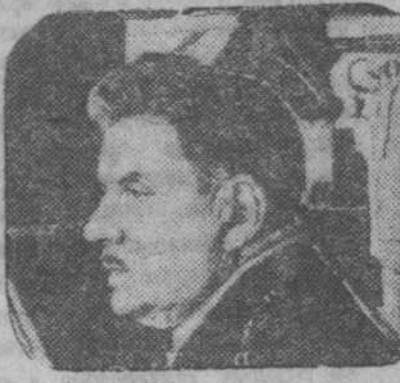
На снимке: Эдуард Эррио, избранный председателем французского правительства.

в обстановке порядка и общественной безопасности. Правительство призывает народные массы сохранять спокойствие, не поддаваться панике и не верить ложным слухам, распространяемым противниками народного фронта. Правительство призывает трудящихся довериться ему и дать правительству возможность удовлетворить их требования законными путями. С другой стороны, правительство призывает предпринимателей проявить максимум уступчивости при рассмотрении требований рабочих. Можно было бы только сожалеть, если бы предприниматели не откликнулись на этот призыв и если бы вышло бы, что продолжение непереносимости с их стороны связано с приходом к власти нового правительства. Без страны в целом должна сохранить свое хладнокровие, заявил в заключение Блюм. Этого требует великое будущее, открывающееся перед французской демократией. (ТАСС).