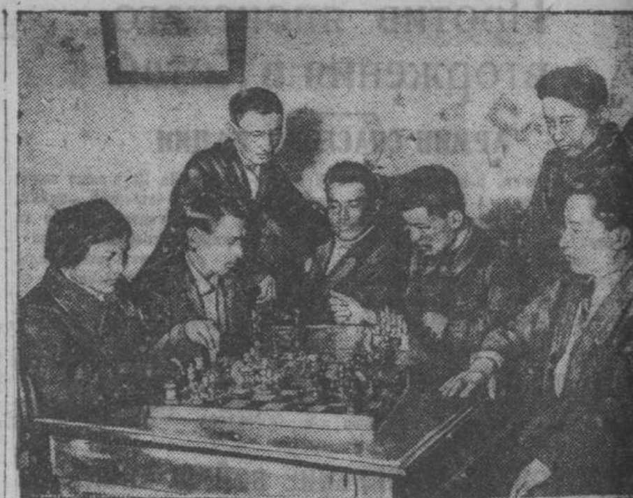
В напиевском клубе на Нижней колонии организован шахматно-шахечный кружок. Ежедневно по вечерам там собирается молодежь и проводит соревнования по шахматам и шашкам.