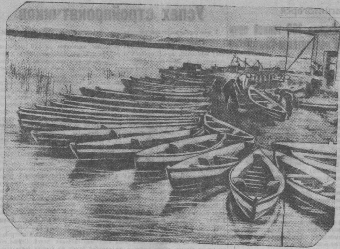
150 лодок полностью отремонтированы на водной станции. Часть из них уже покрашена и вполне готова к спуску на Кондому. На снимке: отремонтированные лодки на водной станции. (Фото Бажина).

ЛОНДОН, 5 июня. По сообщению агентства «Рейтер», сегодня в английском министерстве иностранных дел возобновились англо-советские морские переговоры. Заседание продолжалось два с половиной часа. По сведениям агентства, переговоры продвинулись вперед. Следующее заседание — 12 июля. (ТАСС).