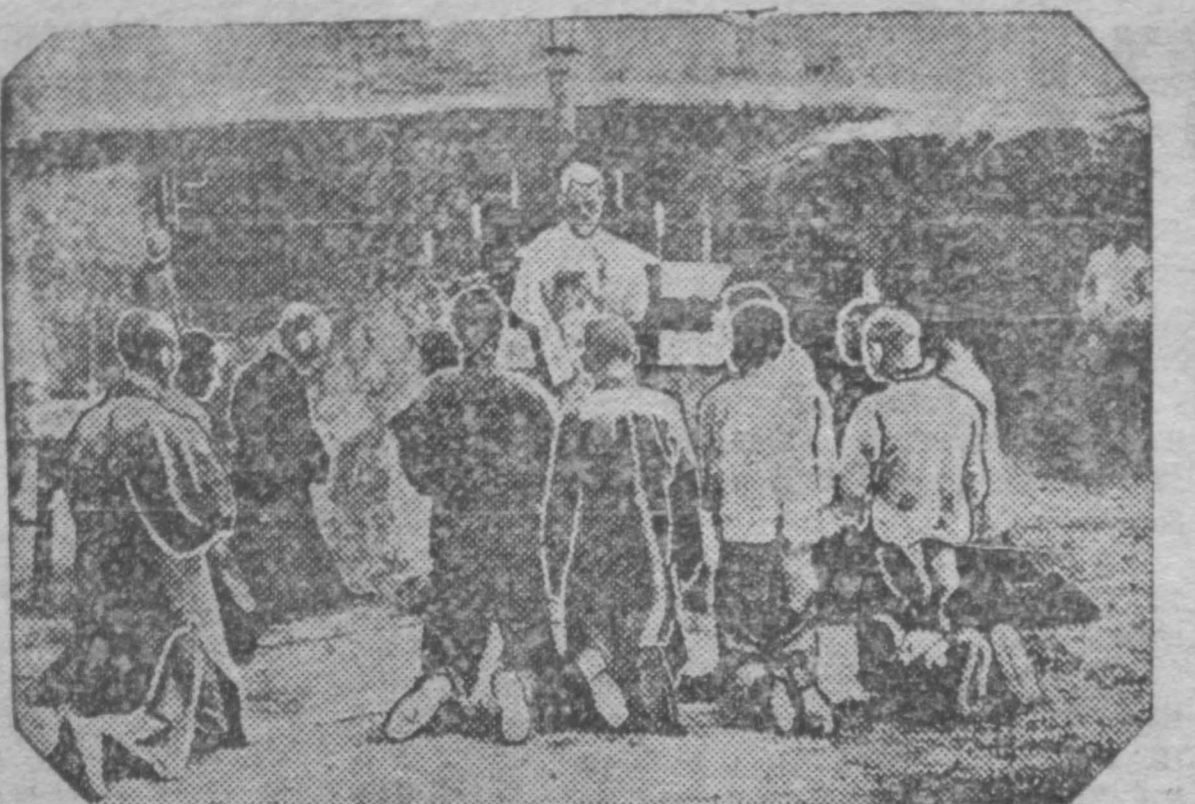
Издательства над китайскими крестьянами в Манчжурии. На снимке: законники в цепи и колоды китайские крестьяне, так называемые «бандиты», получают от католического священника «епископские причастия» перед казнью. Они захвачены японскими частями в районе Цицикара.