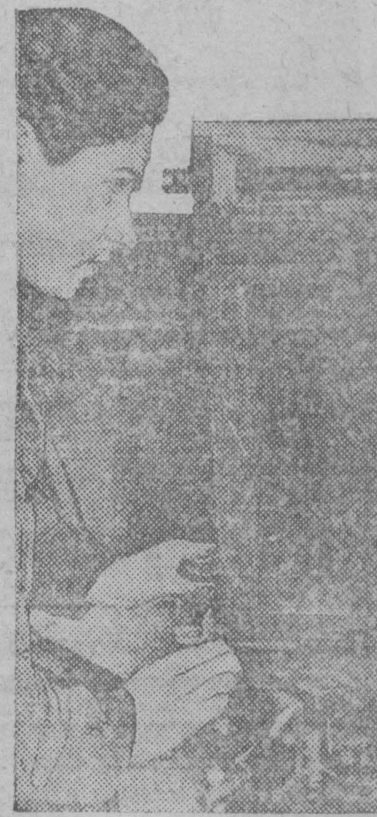
Ленинградский экспериментальный институт выпустил первые менделеевские весы, работающие с точностью до одной сотой миллиграмма.

И пушки неслось Гремели опять, И пули детели Крушило града... И пала, Не в силах Долгие стоять, Поседлала Баррикада.