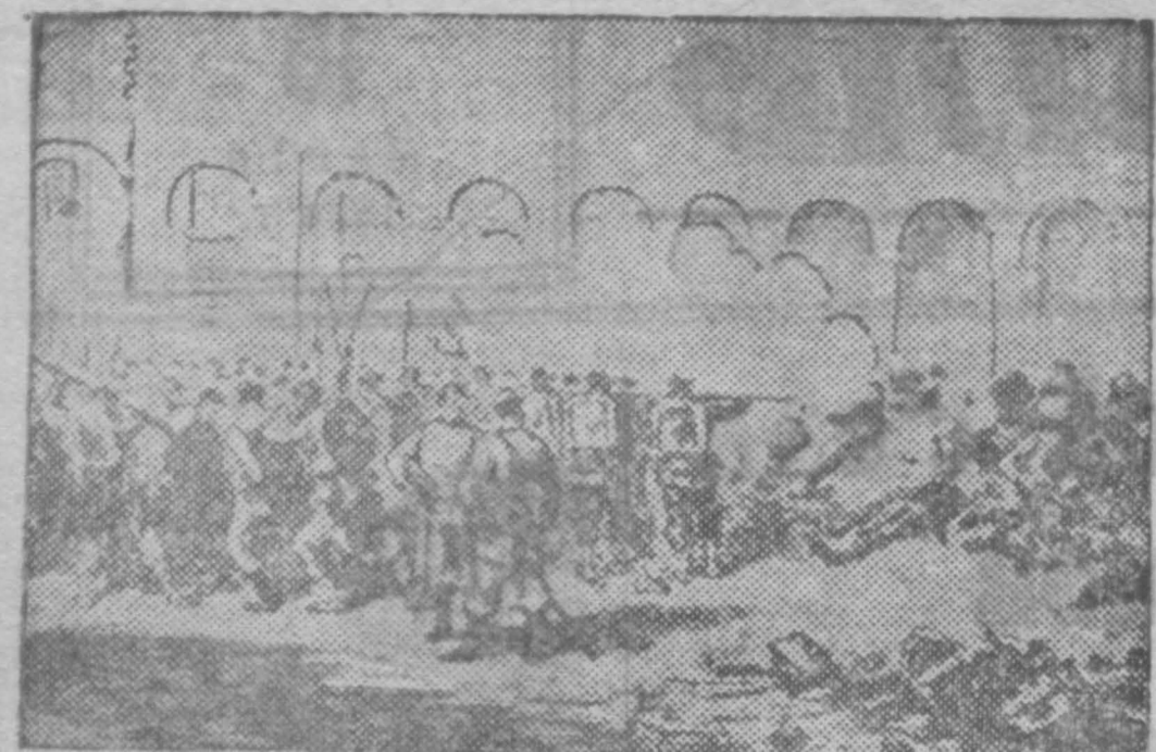
В дни Парижской коммуны.

На снимке: расправа версальцев с побежденными коммунарками. Расстрел коммунарков в казармах Добо.