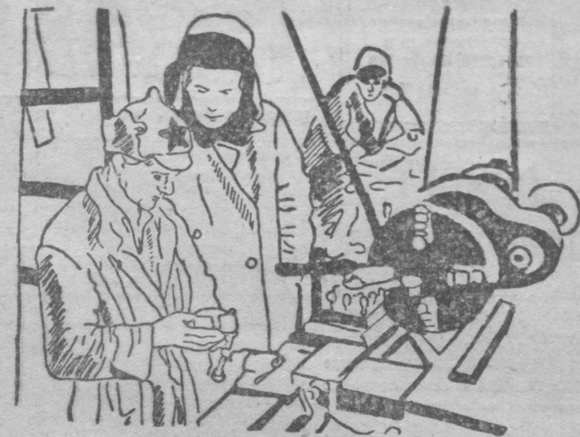
Все тракторы должны быть отремонтированы в срок. В мастерских МТС идет ударная работа над отдельными деталями. На снимке: в мастерской Сталинской МТС.

18 марта 1934 года дало толчок к усиленной организации помощи австрийским рабочим. Миллионы франков были собраны и посланы в Австрию. Сотни людей были вынуждены из рук палачей. В этой кампании МОПР конкретными фактами своей солидарности доказала, что она действительно является внепартийной. Ее помощь оказывалась всем жертвам австрийского фашизма, будь то штурмовики, социал-демократы или коммунисты. Свыше 600 штурмовиков, благодаря солидарности МОПР и трудящихся советской страны, обрели в Советском Союзе свою вторую родину; более 100 детей штурмовиков выехали в СССР.