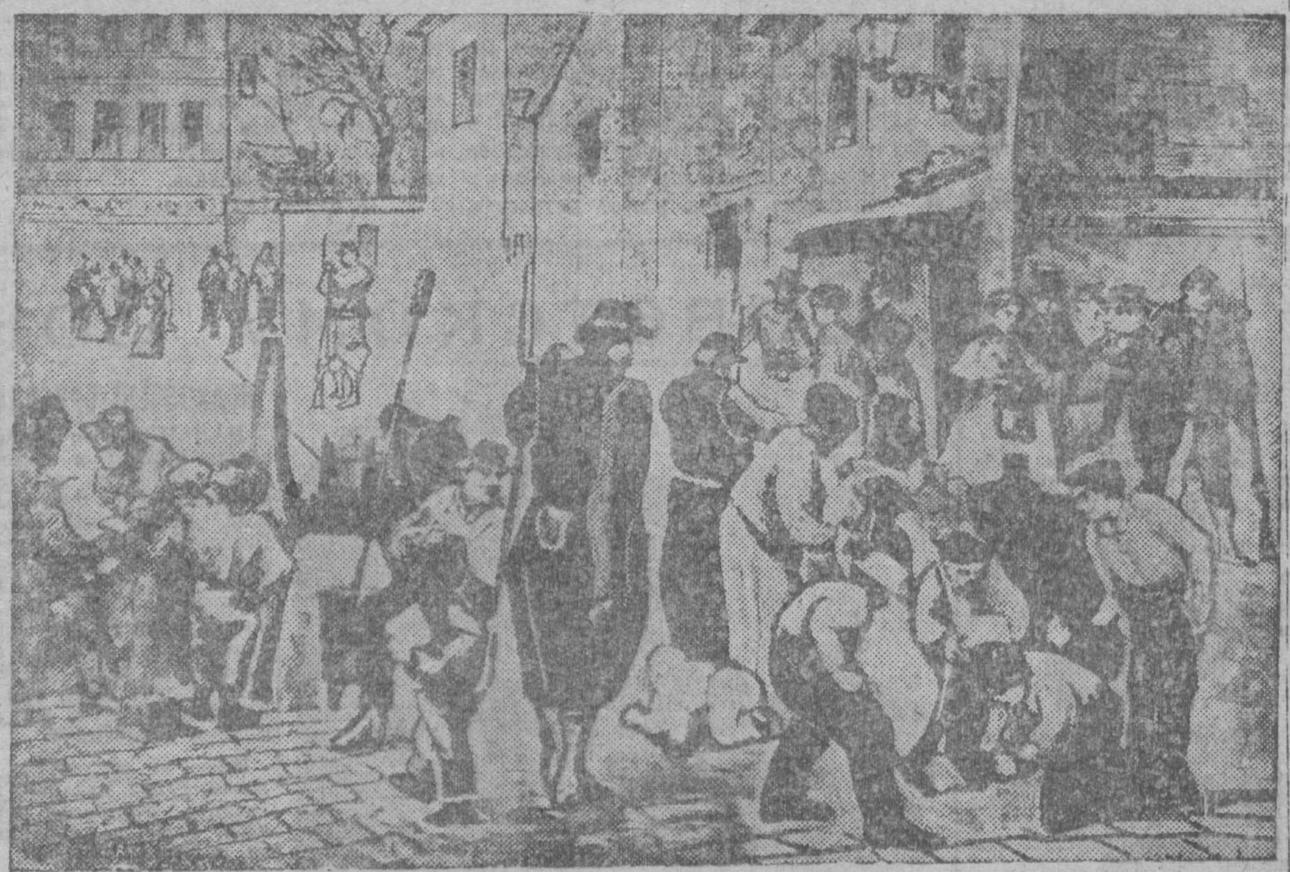
В дни Парижской коммуны. На снимке: постройка баррикады на одной из улиц Парижа.

ам врага! Именно в этом году успех Советского Союза более очевиден, чем когда-либо. Социалистическое строительство шагает вперед гигантскими шагами. Это вызывает бешеную ярость врагов советской власти против трудящихся — победителей советской страны. Мировые хищники изо дня в день ведут беспощадную травлю власти рабочих и крестьян.