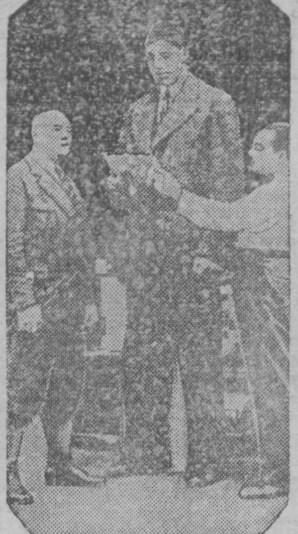
На снимке: финский боксер Бэн Миллионен, один из наиболее высоких по росту спортсменов Европы (рост 2 м. 87 см., вес 165 кг.).