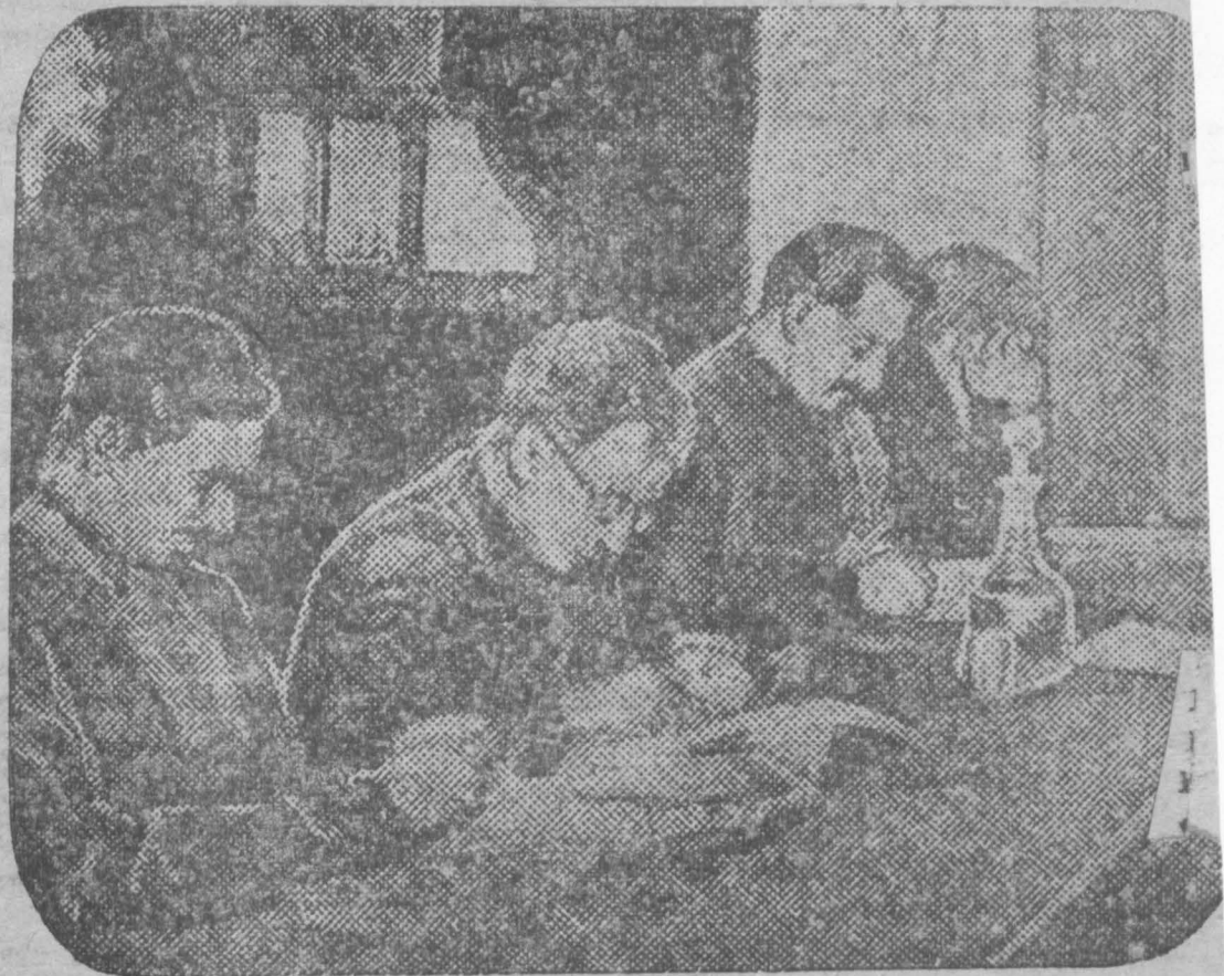
Тов. Орджоникидзе на совещании мастеров металлургии.

Мы не стоим на одном месте в этой отрасли промышленности. Наоборот, созданы новые производства, построены новые заводы. По сравнению с нашими потребностями, этого мало! Перед химической промышленностью стоят большие, ответственные задачи. Надо закончить строительство второй и третьей очереди Сталинградского химического комбината, второй очереди Горьковского комбината, закончить строительство в Кемерово, Липецке, Каменском, Запорожье, строительство Чирчинского комбината. Пролетарияты последние годы несли и будут несли на себе тяжелое бремя войны. Нам надо развивать производство пластмасс, искусственного шелка. Строить калийный рудник, расширить производство на апатитах.