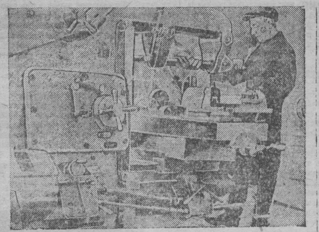
На 2-ой всесоюзной выставке станкостроения, открывшейся в Москве и 7 съезде советам.

Продукция стройматериалов составляет 136 процентов к 1930 году. Стройиндустрия должна быть реорганизована в дальнейшем.