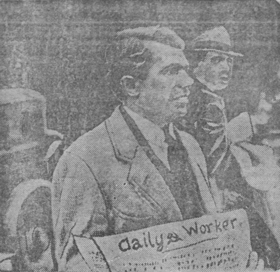
На днях группа видных американских журналистов и писателей вышла на улицы Нью-Йорка, чтобы лично распространить среди публики коммунистическую газету «Дейли Уоркер», которая ведет успешную кампанию за повышение своего тиража.