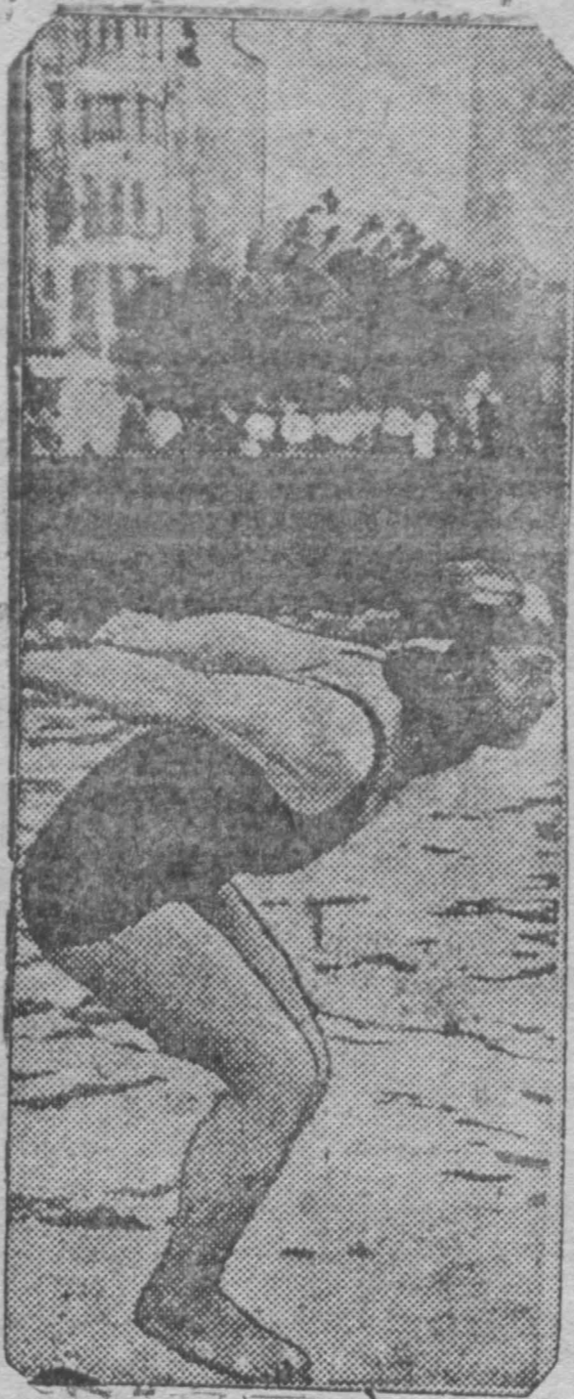
Бакинские физкультурники усиленно готовятся к 3-й Азербайджанской спартакиаде и очередным союзным соревнованиям.