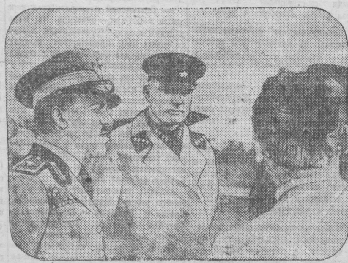
В ответ на вызов в СССР предствителей итальянской авиации во главе с бывшим министром авиации маршалом Итало Балбо...