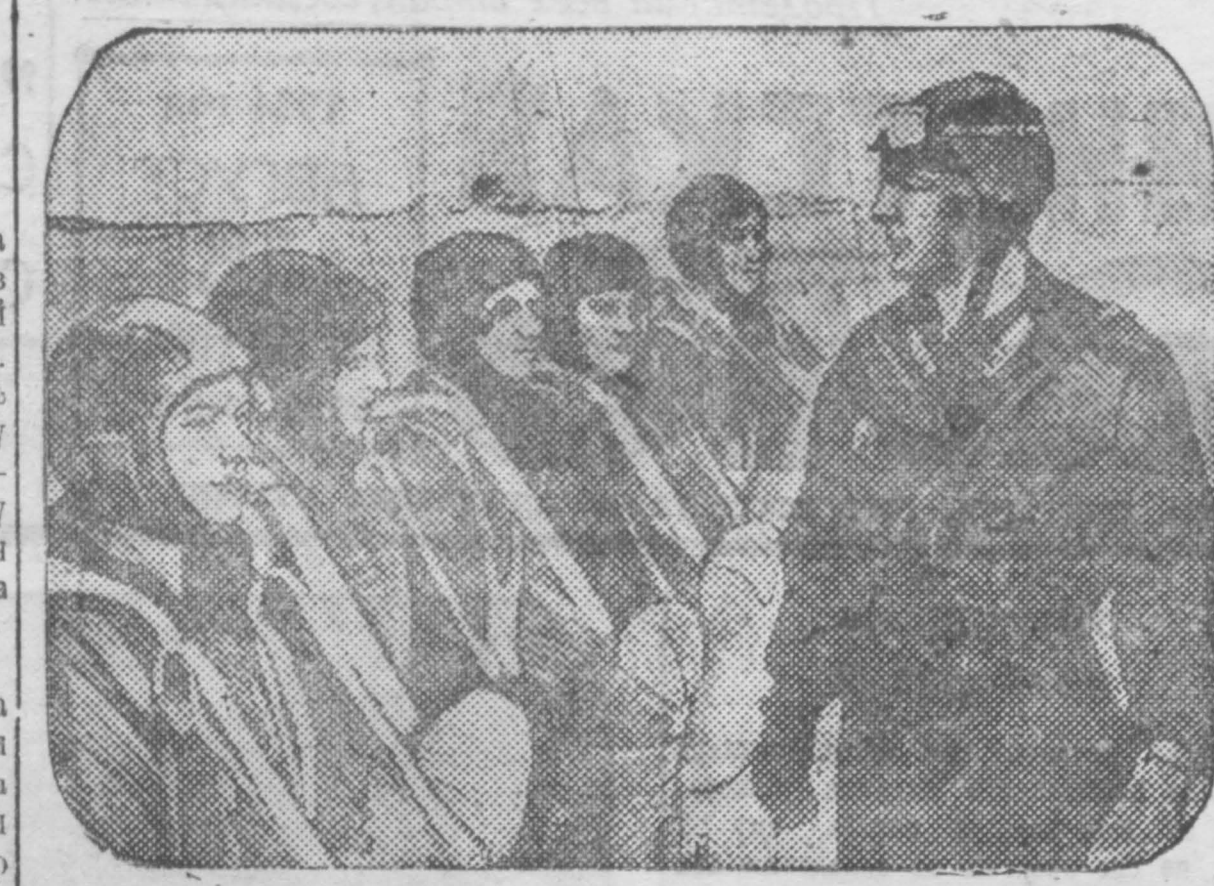
6 августа в Тушино аэродроме ОСАвиаконма состоялся большой авиационный праздник...