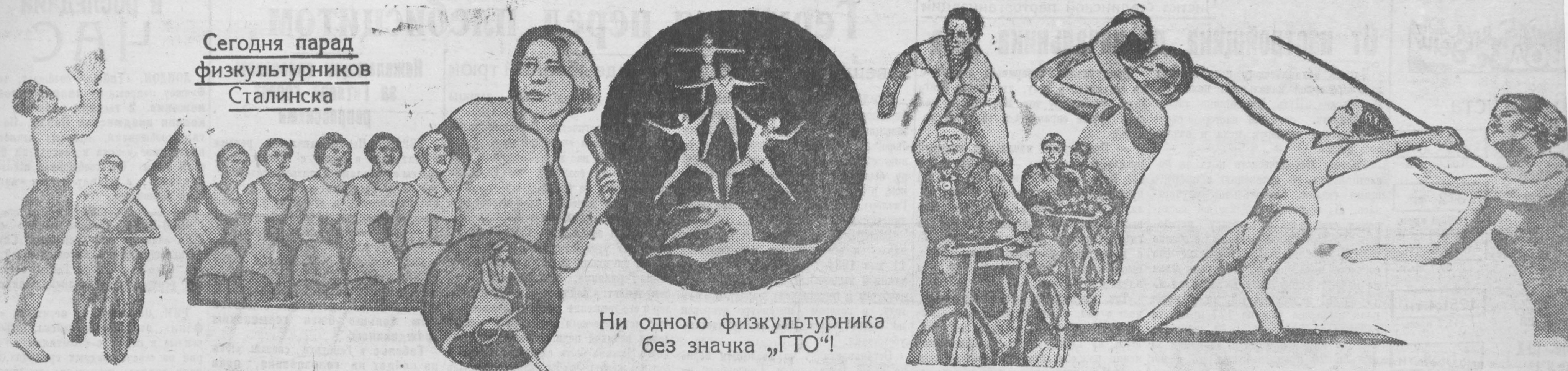
Ни одного физкультурника без значка „ГТО“!