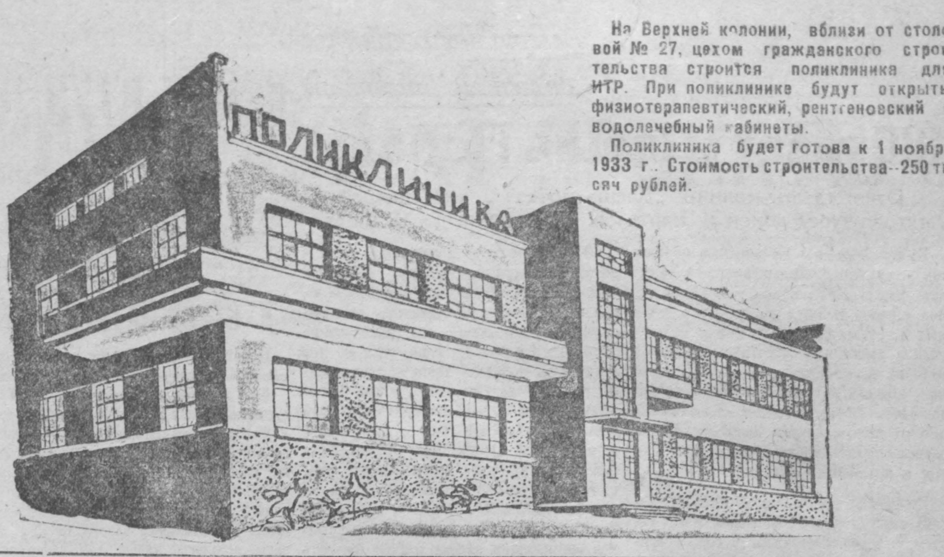
На Верхней колонии, вблизи от столовой № 27, цехом гражданского строительства строится поликлиника для ИТР. При поликлинике будут открыты физиотерапевтический, рентгеновский и физический кабинеты. Поликлиника будет готова к 1 ноября 1933 г. Стоимость строительства — 250 тысяч рублей.

учебы. Мы будем бороться за высококачественный ремонт, за лучшее оборудование школ, за рабочую комнату, за то, чтобы школа стала действительно образцовым, уютным, культурным учреждением, равно лагающим детей к борьбе за знания. 5. По примеру бригад передовых колхозов, показавших лучшие образцы социалистического труда на полях, обязуемся вместе с органами народного образования, примерно, к 25 августа организовать в Сталинске и Кемерово пробный разовый выход детей и педагогов в класс во всеоружии тщательной и продуманной подготовки к учебе. 6. Реализуем эти обязательства к началу учебного года, борясь за каждый пункт этого обязательства со всей бесположной непримиримостью, обе газеты, вместе с тем, ставят своей задачей в течение всего учебного года помогать школе во всех ее многообразных нуждах, помогать молодому учителю, освещать жизнь школы серьезно и глубоко и постоянно сколачивать вокруг школы крепкий коз стьяк пролетарской и колхозной общественности, которая должна ближе стать к школе и воспитанию подрастающего поколения в духе коммунизма. 7. Договор этот подписан на Западно-Сибирском краевом сезде по народному образованию в г. Новосибирске 26-го июля 1933 г. Проверка выполнения этого договора — через декаду после начала учебного года. Арбитрами по соревнованию избираем газеты „Советская Сибирь“ (Новосибирск) и „3а коммунистическое просвещение“ (г. Москва). „Большевистская Сталь“ — Л. Римский „Кузбасс“ — Куприянов