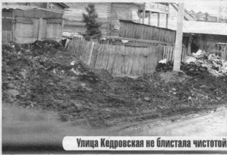
Улица Кедровская не блистала чистотой.