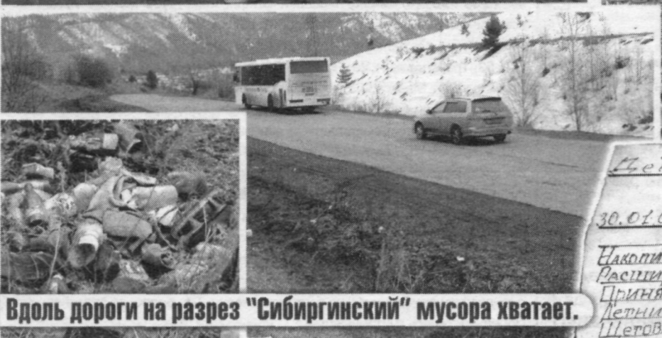
Вдоль дороги на разрез "Сибиргинский" мусора хватает.