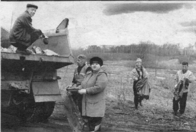
Коллектив ООО «Дорстрой» очищал обочину областной трассы.