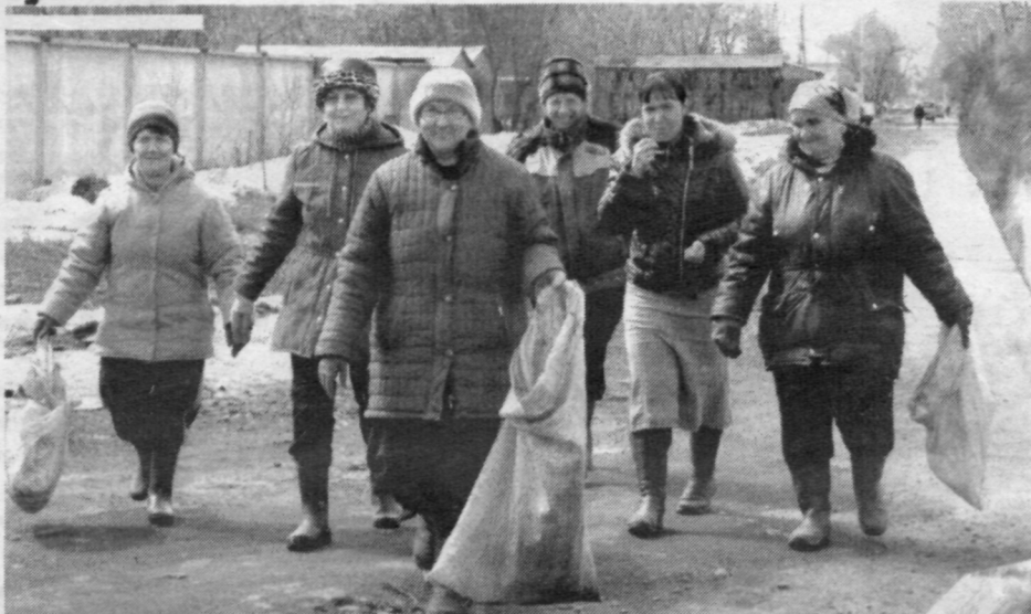
Дружно вышли на субботник работники ООО «Притомский».