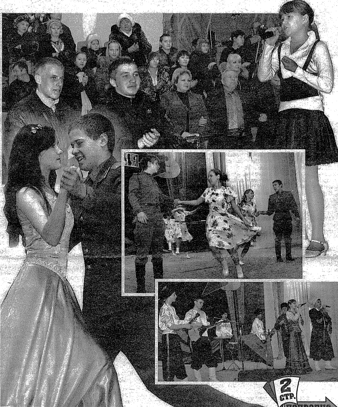
В КСК «Юбилейный» прошел 7-й городской фестиваль-конкурс патриотической песни «Виктория», посвященный Дню защитника Отечества (на снимках).