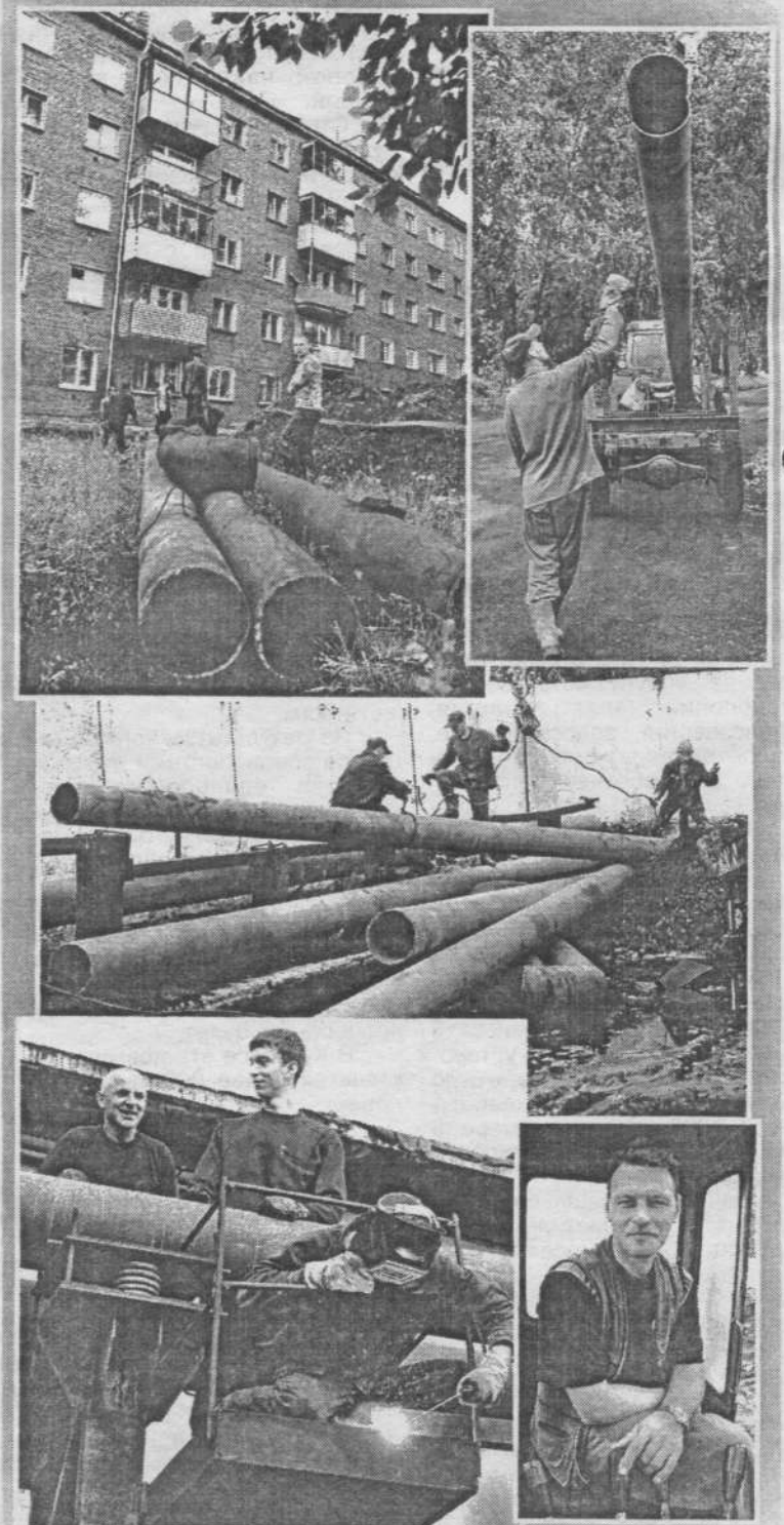
На снимках: одно из мероприятий подготовки к зиме - ремонт теплотрассы у поселковой котельной.