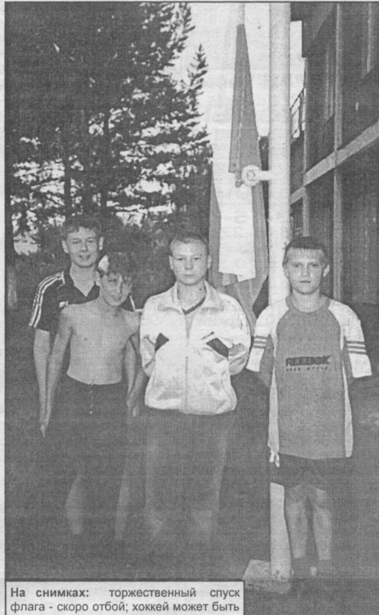
На снимках: торжественный спуск флага - скоро отбой; хоккей может быть не только ледовым, но и настольным.

В общем, ребята к концу тренировочного сезона достигли пика спортивной формы, полностью адаптировались к строгому режиму дня. Большинство ребят с большим желанием хотели бы вновь вернуться в лагерь на следующий сезон, но, к сожалению, им пришлось попрощаться с ней под традиционный костер, который сопровождался чаепитием,