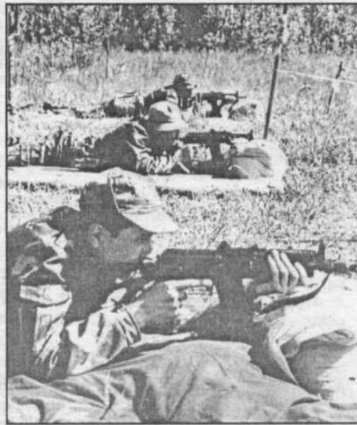
Материал об учебных военно-полевых сборах школьников публикуется на 2-й странице газеты.

На снимках: будущие защитники города; на огневом рубеже.