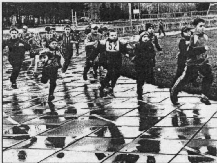
На снимках: хлеб-соль - олимпийскому чемпиону; парад участников; автограф на память; во время забега.