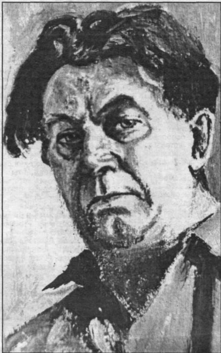
А. Краснов. Автопортрет.

Запомнилось и то, что он не подавлял мое невежество, мою неопытность в наивных, кажется, вопросах молодого и, как было сказано выше, неопытного еще журналиста. А вот его уроки, ес-