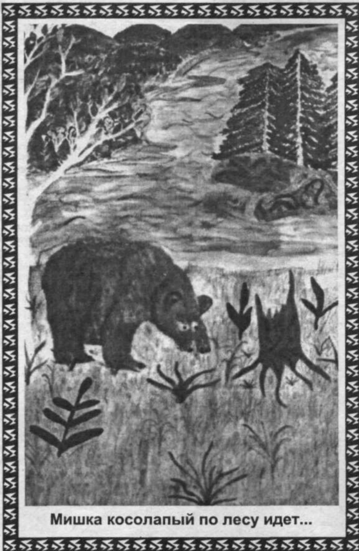
Мишка косолапый по лесу идет...