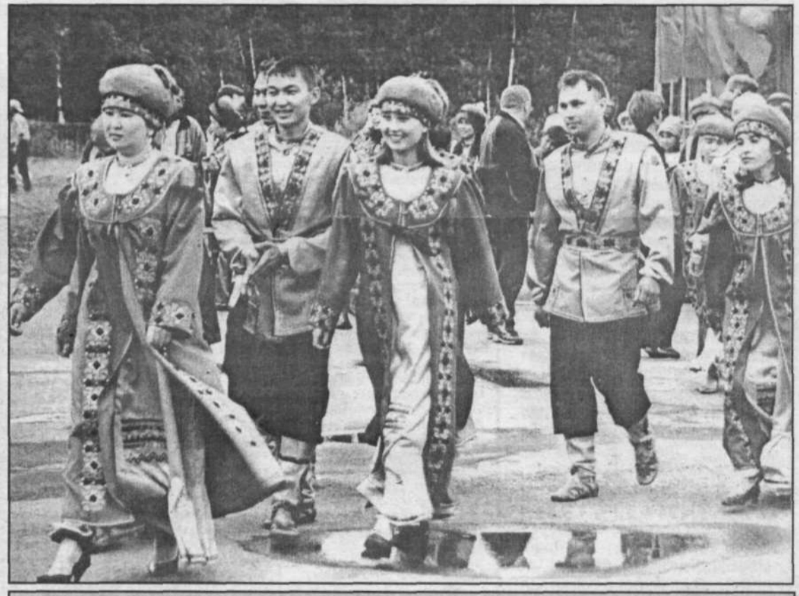
Материал о празднике читайте на 2-й странице газеты.

На снимках: во время открытия - шаманский бубен отгоняет злых духов; гости "Пайрама".