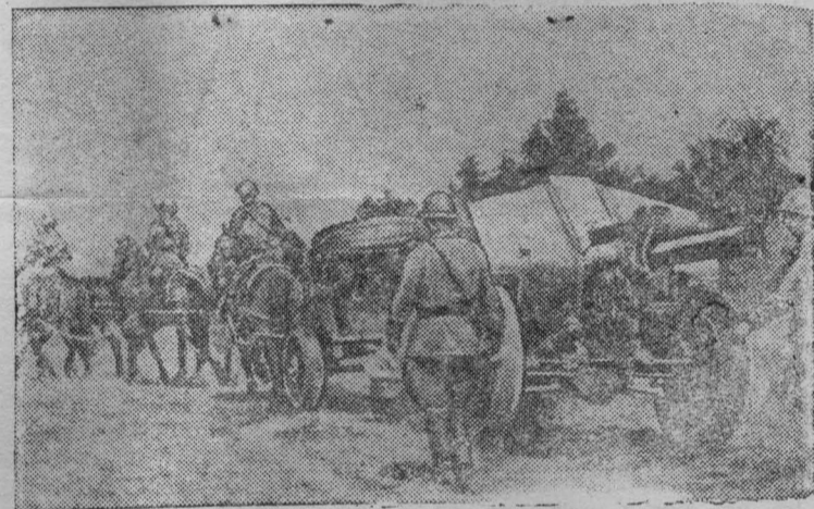
Советские артиллеристы продвигаются на передовые позиции