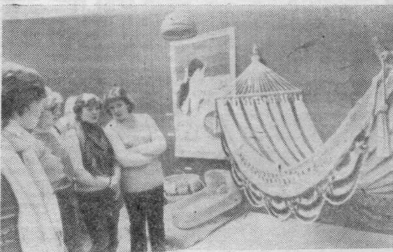
В Москве во Всероссийском музее декоративно-прикладного и народного искусства открылась выставка народного творчества Республики Никарагуа. Здесь изделия, созданные гончарами и ювелирами, резчиками по камню и дереву, мастерами плетения. На снимке: в зале выставки.