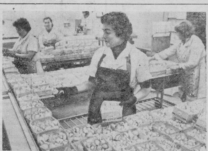
Крупнейший в Советском Союзе «конвейер» по производству грибов-шампиньонов на промышленной основе действует в совхозе-комбинате «Московский».

На площади в один гектар построен современный комплекс, в котором установлены компрессорные и холодильные установки, кондиционеры и увлажнители воздуха, имеются залы хранения и расфасовки продукции. Грибы выращиваются в 27 камерах. Технологический процесс полностью автоматизирован. Электронные устройства позволяют создать для каждой камеры площадь в 420 квадратных метров свой микроклимат, поддерживать в воздухе заданные температуру и влажность.