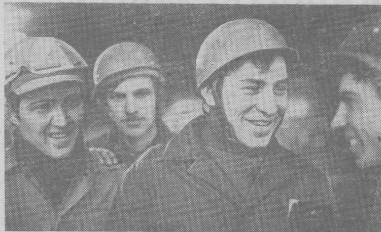
...Ввести в действие мощности на Сургутской ГРЭС...