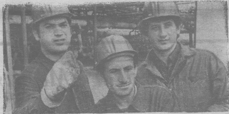
ГРУЗИНСКАЯ ССР. «Пятнадцать республик — пятнадцать трудовых вахт» — под таким девизом развернулось социалистическое соревнование в честь 50-летия СССР на Батумском нефтеперерабатывающем заводе.

Каждые 15 дней трудовая вахта на предприятии проходит под знаменем одной из союзных республик.