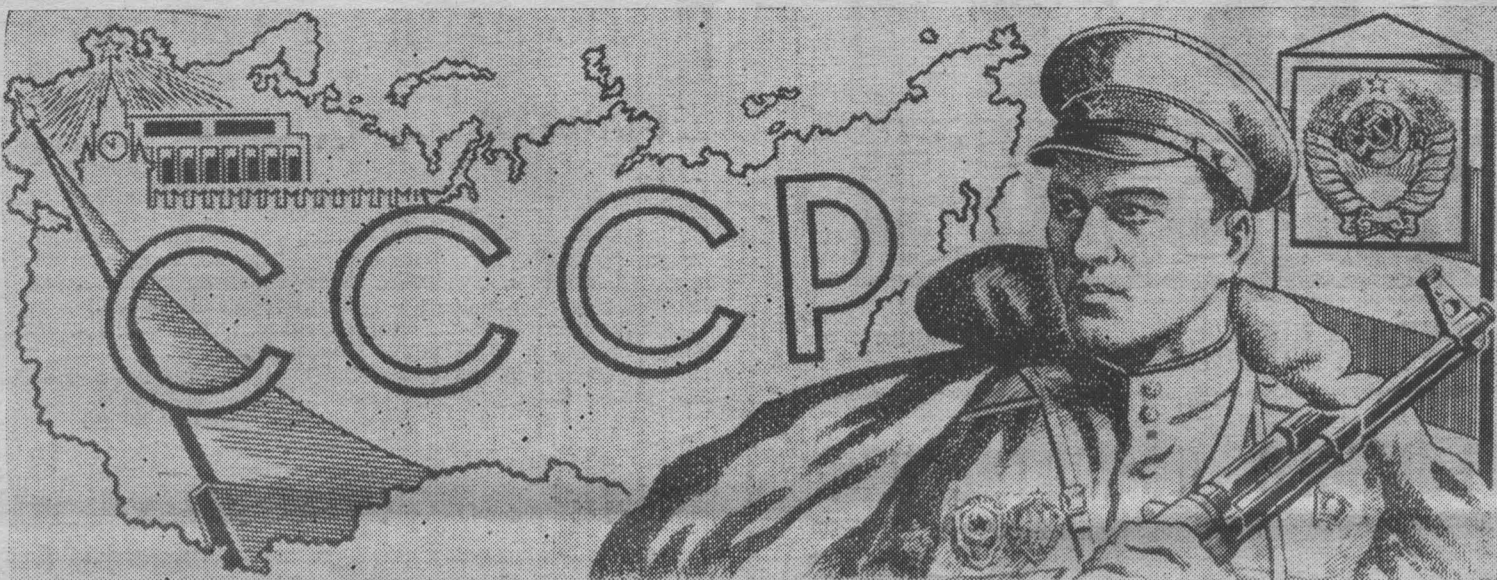
ПЛАКАТ ХУДОЖНИКА С. ГРИНЬКО.