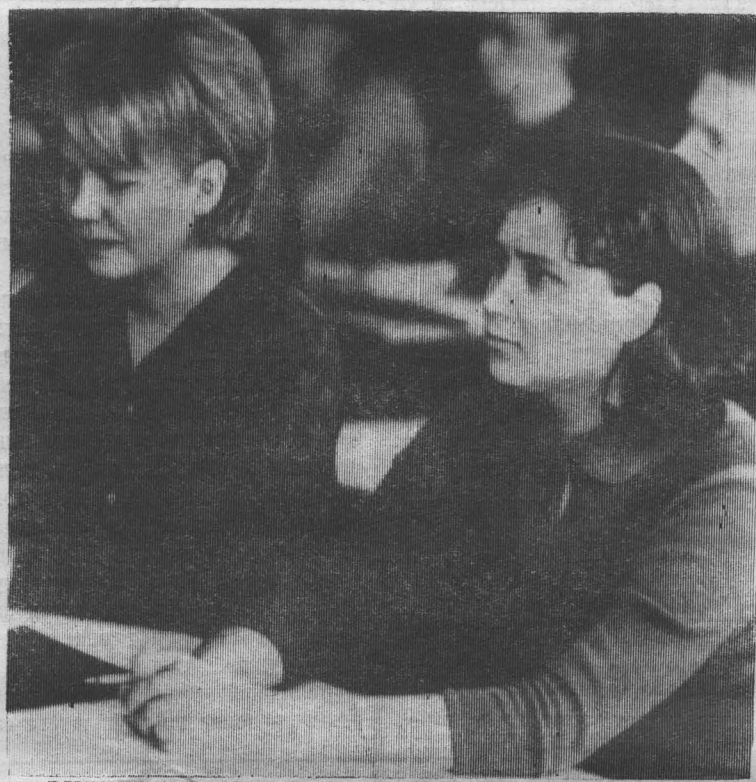
ЭНЕРГОСТРОИТЕЛЬНЫЙ ТЕХНИКУМ, ИДУТ ЗАНЯТИЯ.

помещении магазина утерянный кем-то кошелек с деньгами. Просьба к потерявшему деньги зайти и получить их,