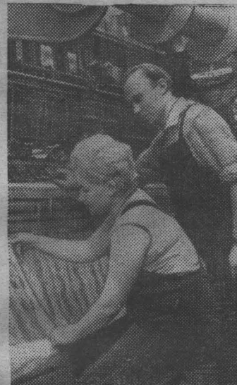
ТАЛЛИН. Более 16 миллионов трикотажных изделий выпускает за год коллектив фабрики «Марат». В первом полугодии осваивается 45 новых образцов белья и верхнего трикотажа.