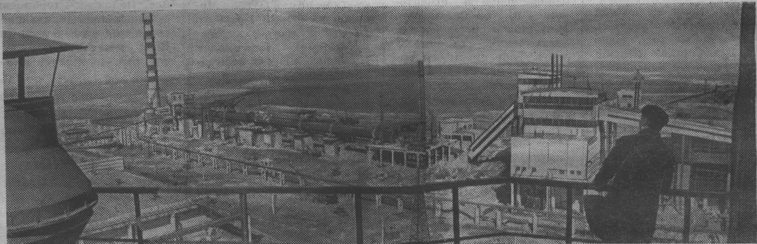
НИКОЛАЕВСКАЯ ОБЛАСТЬ. Возле прибургского села Григорьевка выросли цехи нового цементного завода, который должен войти в строй в нынешнем году. Уже смонтирована гигантская вращающаяся печь, заканчивается сооружение главного корпуса.

На снимке: панорама строительства цементного завода.