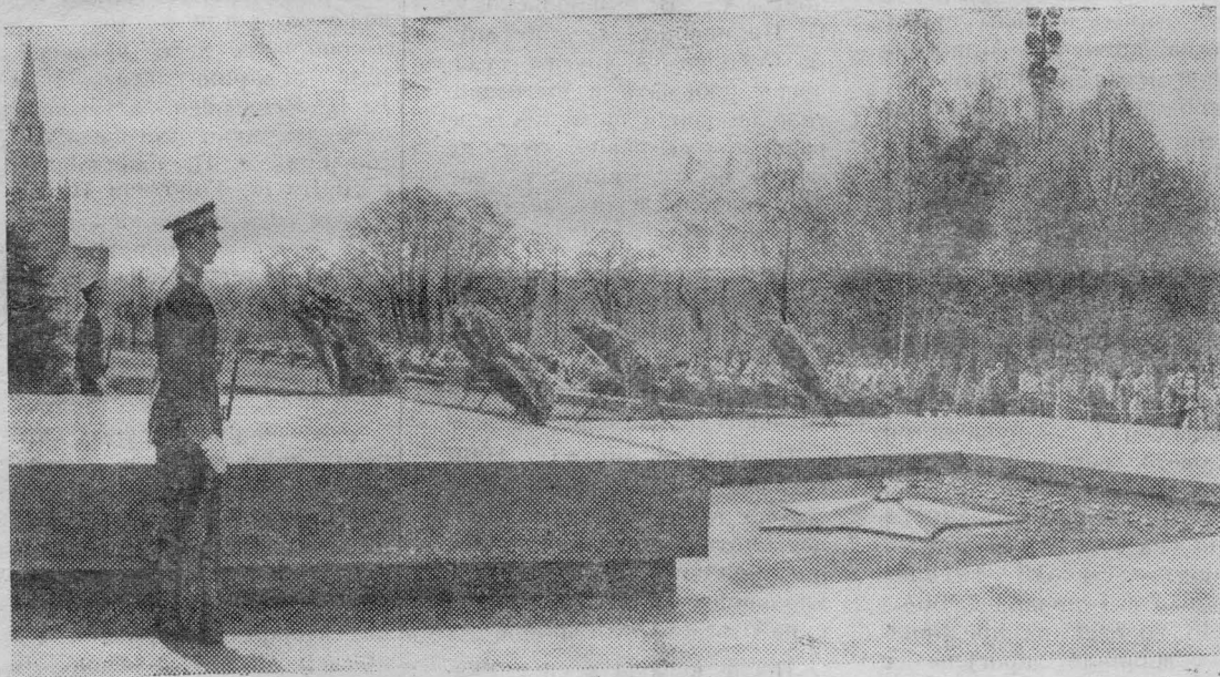
МОСКВА. 8 мая у Кремлевской стены был торжественно открыт памятник «Могила Неизвестного солдата» с Вечным огнем славы. На снимке: Почетный караул у могилы Неизвестного солдата.