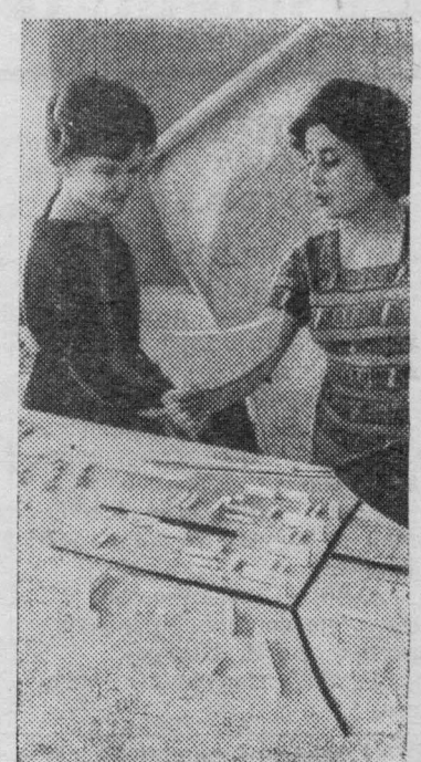
«ПУТЬ К ПОБЕДЕ» 15 февраля 1967 г. стр. 3

Коллектив предприятия вот уже второй год выпускает фасованное в металлических банках сливочное и топленое масло для тружеников Крайнего Севера. Его можно хранить годами.