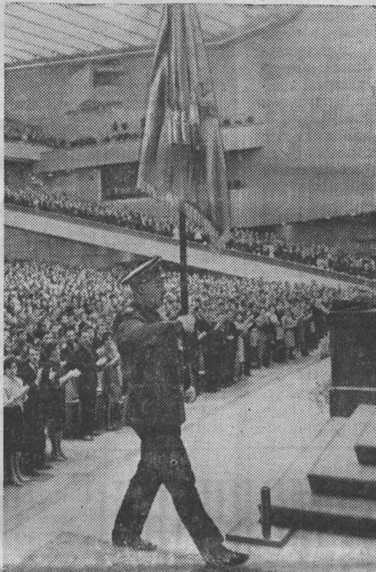
Москва. Кремлевский Дворец съездов. XV съезд ВЛКСМ.

На снимке: летчик-космонавт А. Леонов выносит знамя Ленинского комсомола.