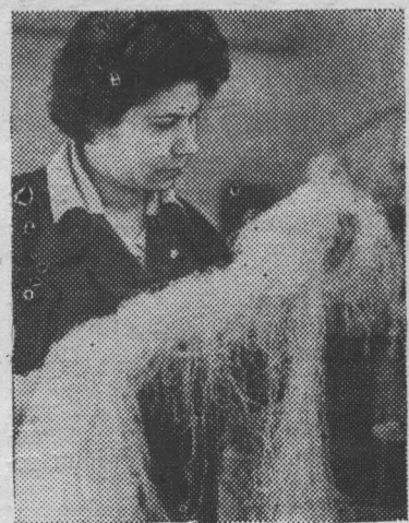
«ПУТЬ К ПОБЕДЕ» 25 мая 1966 г. 3 стр.