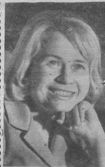
Молодежные песни «Геологи», «Главное, ребята, сердцем не стареть», «Песня о тревожной молодости», «Старый клен», «Хорошие девочки» получили самое широкое признание у советского народа. Они написаны композитором Александрой Пахмутовой, которая очень много сделала для популярности советской массовой песни. Мир ее песен светел и оптимистичен. Героизм и лирика сочетаются в них свободно и органично. Александра Пахмутова продолжает плодотворно работать над новыми произведениями. На снимке: Александра Пахмутова.

Арабская сторона выразила свою глубокую признательность Советскому правительству за всестороннюю экономическую и техническую помощь и содействие, которые Советский Союз оказывает Объединенной Арабской Республике.