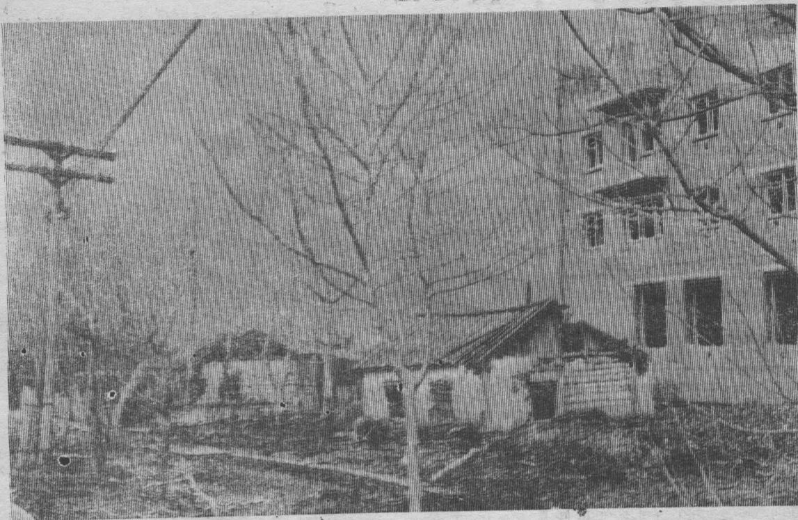
Мыски строятся. Ул. Советская.