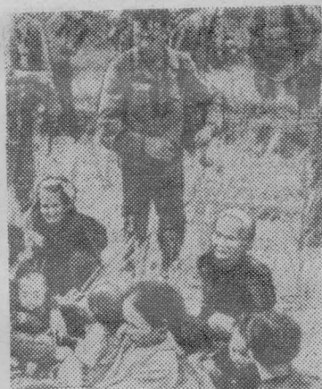
ЮЖНЫЙ ВЬЕТНАМ. Неподалеку от деревушки Хой Сон американские солдаты захватили очередную группу «военнопленных». Как видно на этом снимке, только у младенцев и матерей не связаны руки.

Кроме того, потери американских войск во время этих двух атак составили 270 человек убитыми и ранеными.