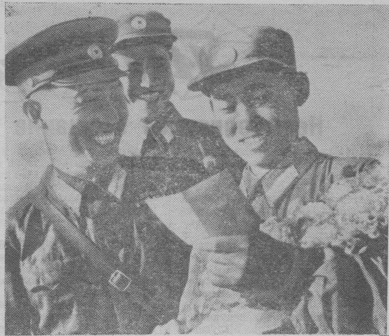
Командиры Корейской Народной Армии поздравляют бойца с присвоением ему почетного звания.