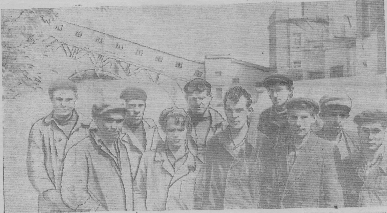
Фото Ю. Хлыбова.

Н. А. Ли; во втором ряду: Г. Н. Шаталов, Э. П. Нолодский, А. А. Хахалин, И. Н. Школа, В. Н. Красуля.