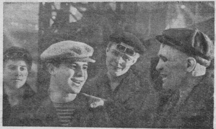
жем стать квалифицированным металлургом.