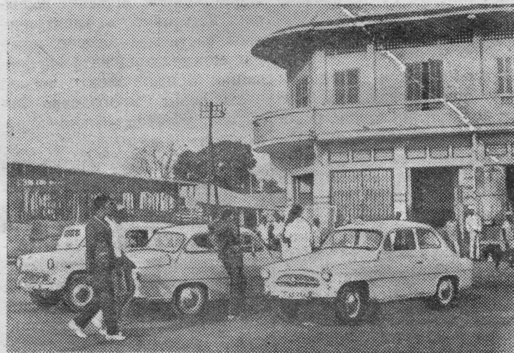
Гвинейская Республика установила тесные экономические связи со странами социалистического лагеря. Растет товарооборот. Советский Союз и другие социалистические государства предоставляют кредит независимой Гвинее, экспортируют в эту страну на льготных условиях нужные ей товары. Из Праги в Конакри отправляют легковые и грузовые машины, специально оборудованные для эксплуатации в тропических условиях.

Газета «Народна армия» пишет, что «доклад Н. С. Хрущева убедителен и неоспорим, потому что вопросы, поставленные в нем, порождены логикой жизни. Решения настоящего Пленума, — пишет газета, — будут иметь значение не для одного, двух или пяти лет. Можно с уверенностью сказать, что они сыграют огромную роль для выполнения 20-летнего плана и для построения коммунизма в Советском Союзе».