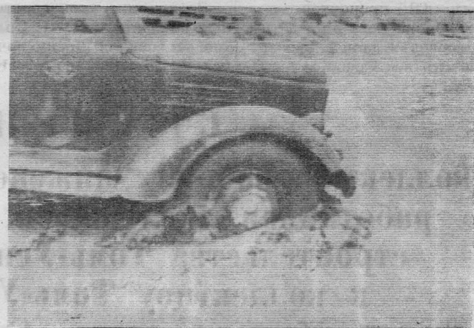
А здесь, как говорят, комментарии излишни.

Никуда не годится и подъезд к строительству школы, которую строит первый участок (началь-