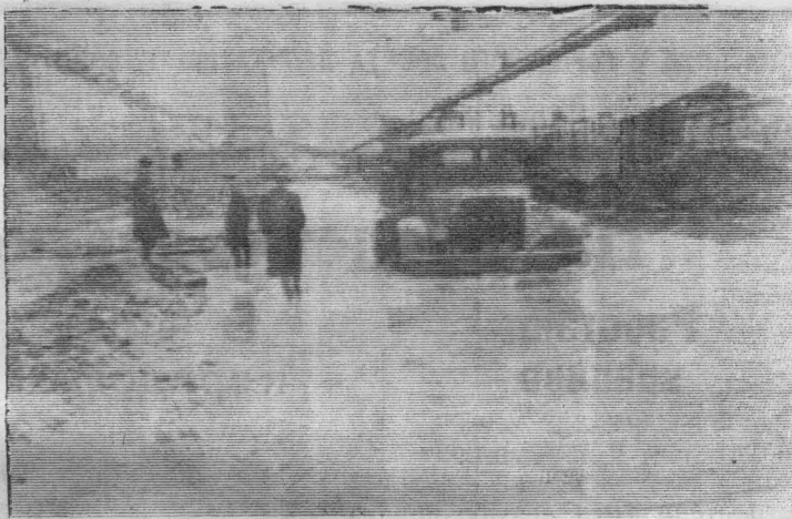
Эту лужу на Томь-Усинской ГРЭС называют «зеркалом» стройки. Метко назвали: посмотрите, какие четкие получились отражения в воде от корпуса машины и фигур идущих людей.