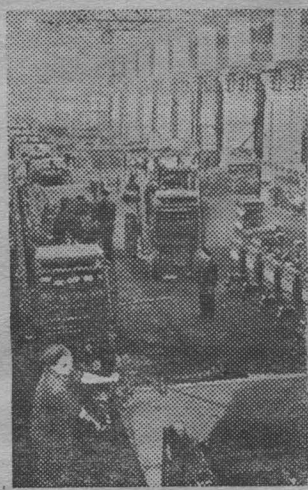
КРАСНОЯРСК. Коллектив комбайнового завода стремится достойно встретить предстоящий Пленум ЦК КПСС.

Начав в этом году серийное производство самоходных комбайнов СК-3, завод уже выпустил семь тысяч таких машин, досрочно выполнив годовой план. Комбайностроители решили в подарок Пленуму ЦК КПСС дать до конца года еще полторы тысячи комбайнов.