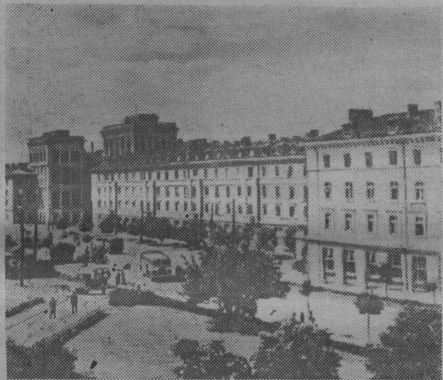
НАРОДНАЯ РЕСПУБЛИКА БОЛГАРИЯ. Кварталы жилых домов в Димитровграде.

Новый завод рассчитан на переработку 300 тысяч тонн нефти в год.