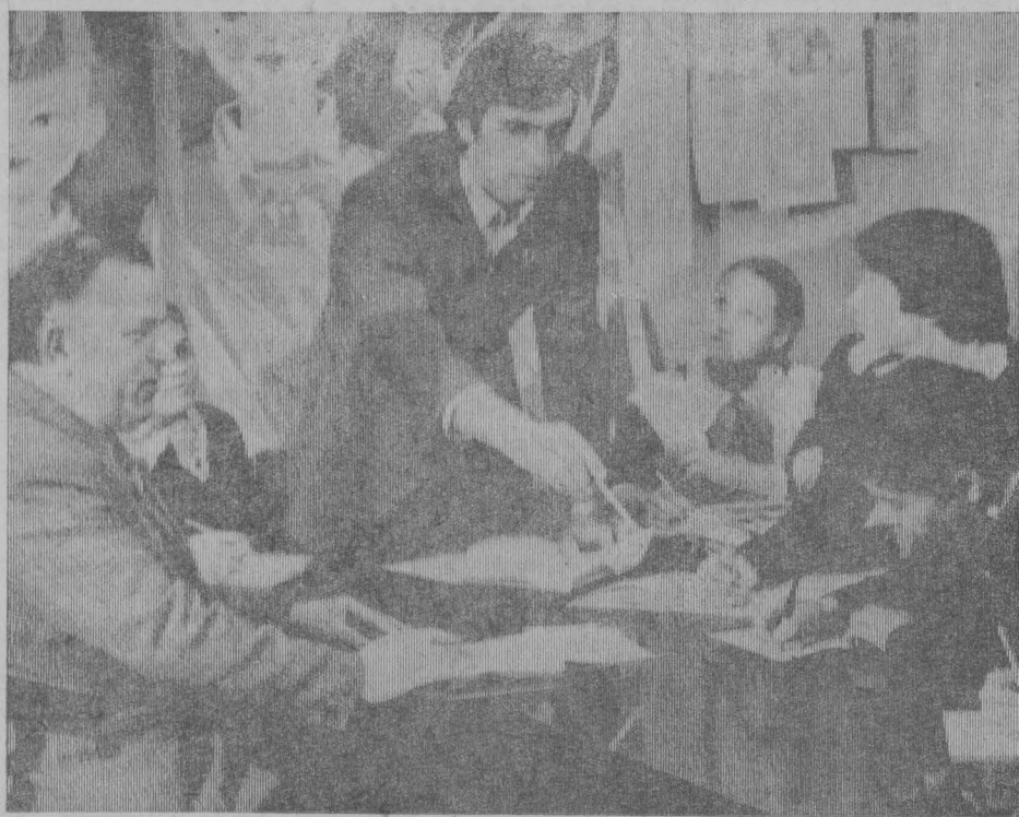
на шахте «Распадская».

Участники семинара побывали и в школах. В средней школе № 24 они познакомились с работой консультационного пункта для членов педотряда, присутствовали на совместном заседании комитета комсомола, совета пионерской дружины школы и педагогического отряда шахты «Распадская». На повестке дня стоял вопрос: планирование работы на зимние каникулы. Вместе со своими шефами ребята съезжают в Новокузнецкий цирк, проведут военно-спортивную игру «Зарница», побывают на экскурсии