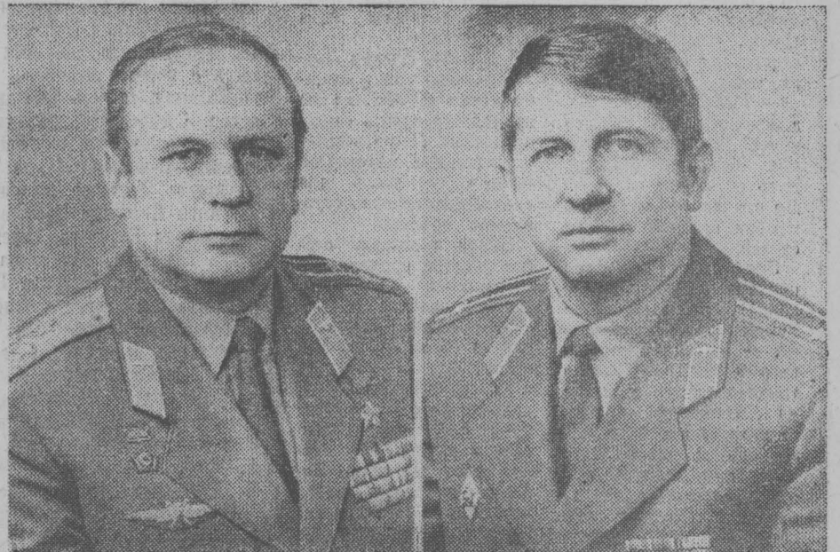
Командир космического корабля «Союз-24» летчик-космонавт СССР, Герой Советского Союза, полковник Винтор Васильевич Горбатко.