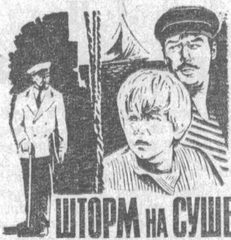
ШТОРМ НА СУШЕ

Для вас, дети, в кинотеатре «Кузбасс» с 22 по 28 ноября демонстрируется новый цветной широкоэкранный художественный фильм «Шторм на суше» производства Центральной студии детских и юношеских фильмов им. М. Горького. Поставлен он по мотивам рассказов замечательного детского писателя Бориса Житкова. В центре фильма — история подростка Мити Храпова, который в условиях предреволюционной России мечтает водить океанские корабли, видеть экзотические страны, а судьба ставит его сызмала выполнять вкаторжный труд.