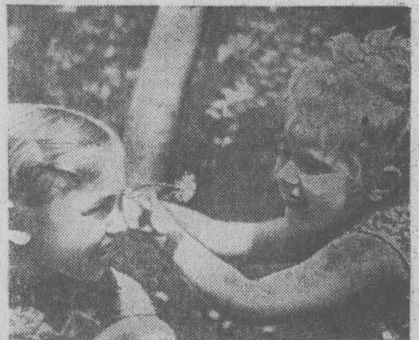
борьбу за претворение в жизнь Декларации прав ребенка во всех странах, за счастье юного поколения, за мир во всем мире.

Все прогрессивные организации и миллионы простых людей нашей планеты активно ведут