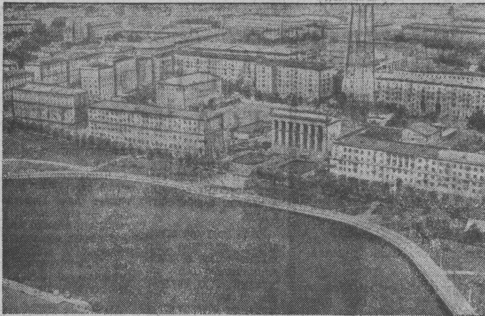
Столица Белоруссии — Минск. Центральная часть города.

Нерасторжимая дружба советских народов, спаянных единством революционных целей, жизненных интересов и коммунистических идеалов, представляет собой могучую преобразующую силу, способную творить чудеса. Об этом красноречиво говорят поистине грандиозные свершения Страны Советов в целом и каждой республики в отдельности, в частности, Белорусской ССР.