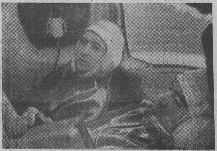
Командир космического корабля «Союз-9» А. Г. Николаев (на переднем плане) и бортинженер В. И. Севаст'янов на тренировках.