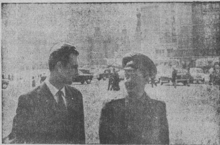
Командир космического корабля «Союз-9» А. Г. Николаев (справа) и бортинженер В. И. Севаст'янов на улицах Москвы.