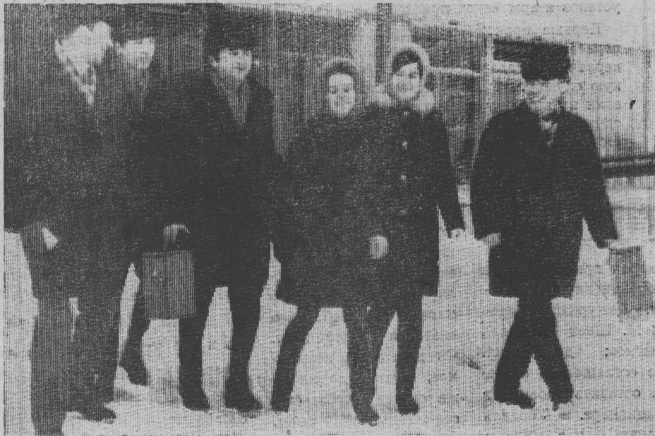
С урной к избирателям...

Исполнительный комитет Междуреченского городского Совета депутатов трудящихся.