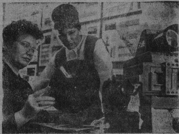
Большую помощь пропагандистам оказывает кабинет политического просвещения Советского райкома КПСС города Челябинска. Пропагандисты регулярно

секретарь парткома шахты «Томусинская-1-2».