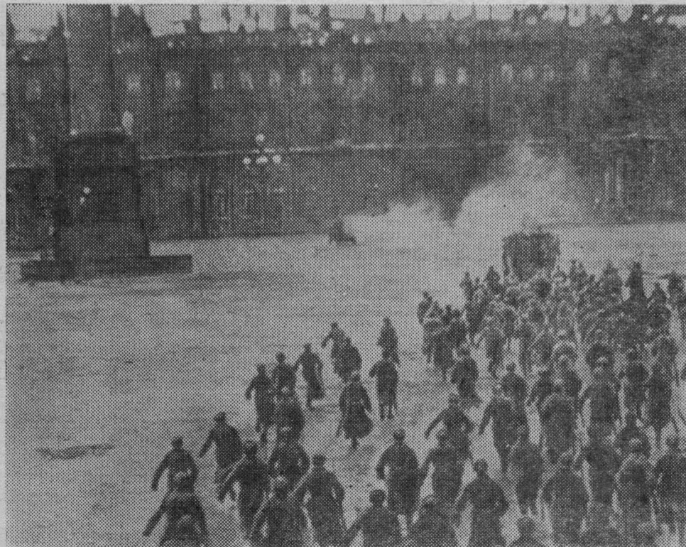
Петроград. 1917 год. Штурм Зимнего дворца. (Снимок из музея истории Ленинграда).