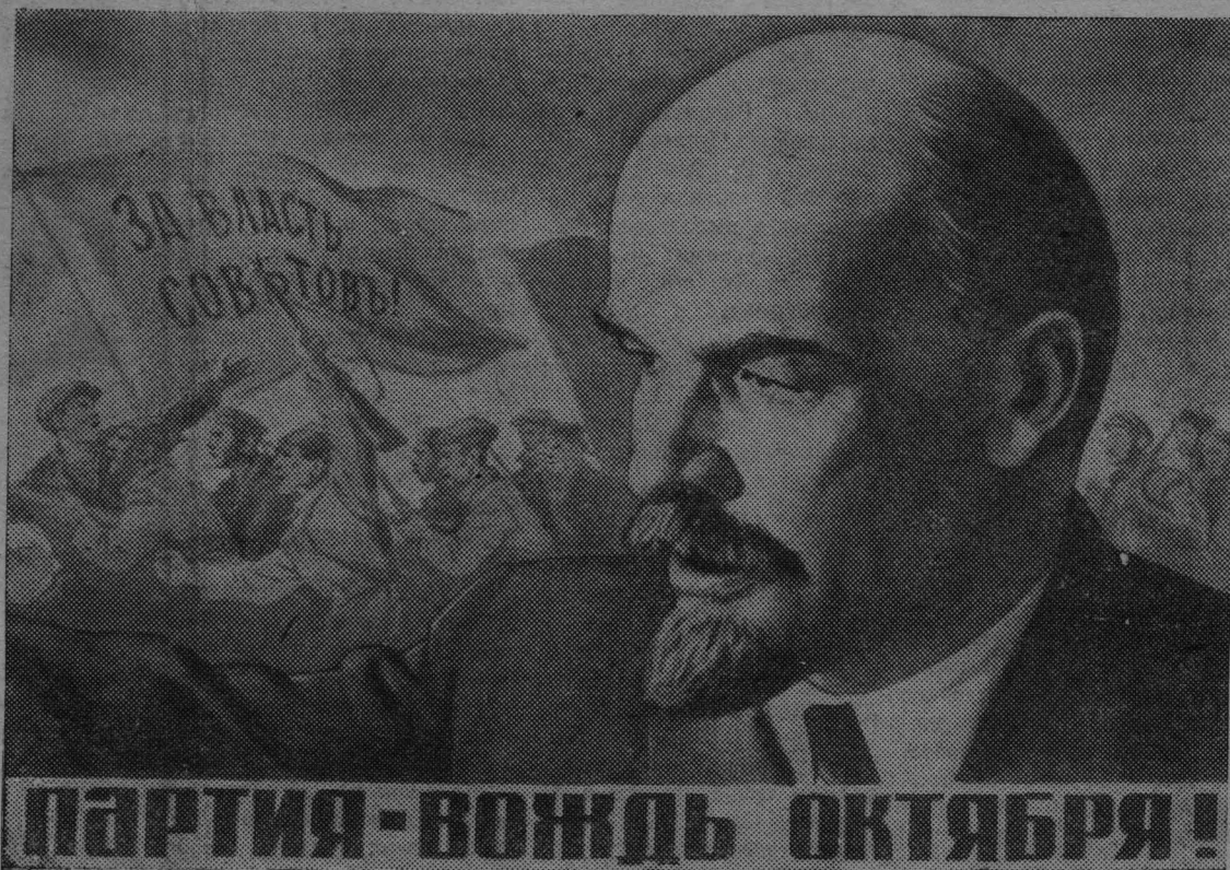
Плакат художника Л. Голованова.

(Из Призывов ЦК КПСС к 50-летию Великой Октябрьской социалистической революции).