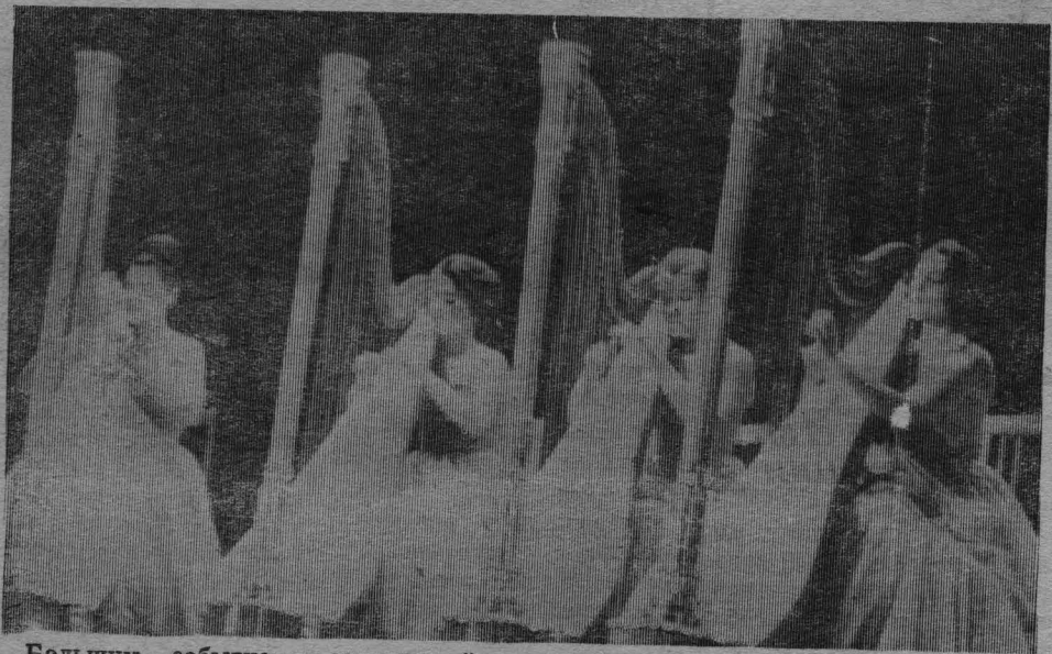
Большим событием в культурной и музыкальной жизни города был концерт квартета арф. Арфистки, лауреаты Московского фестиваля молодежи, с большим мастерством исполнили произведения композиторов Чайковского, Моцарта, Ветховена и Штрауса.

Дело будет слушаться в нарсуде г. Черепанова.