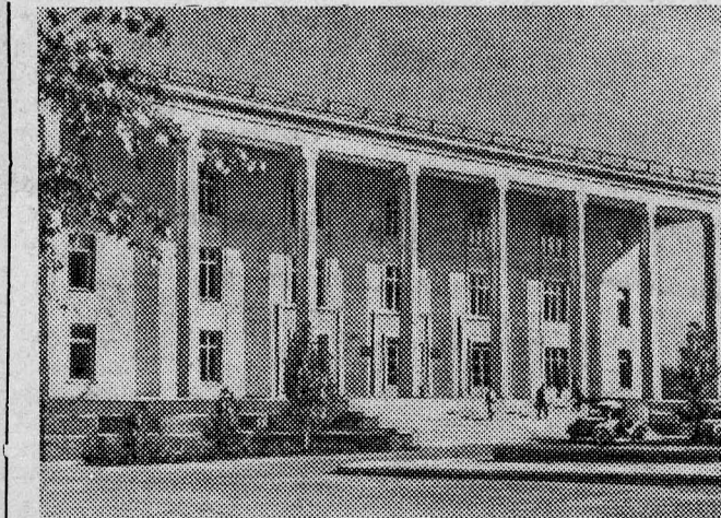
АШХАБАД. Здание президиума Академии наук Туркменской ССР.

На заснеженных склонах таежной сопки четко выделяются огромные корпуса зданий, соединенных приподнятыми над землей галереями. А дальше тянутся уступы рудных горизонтов. Это Коршунувский горнообогатительный комбинат или просто «Коршуниха», как называют его строители. Коршунихой издавна зовется и гора, почти целиком сложенная из магнитного железняка, и протекающая у ее подножья речка, и возникшая неподалеку на магистрали Тайшет—Лена железнодорожная станция. Коршуниха и строящийся рядом с ней новый город Железнодорожск расположены примерно в 150 кило-