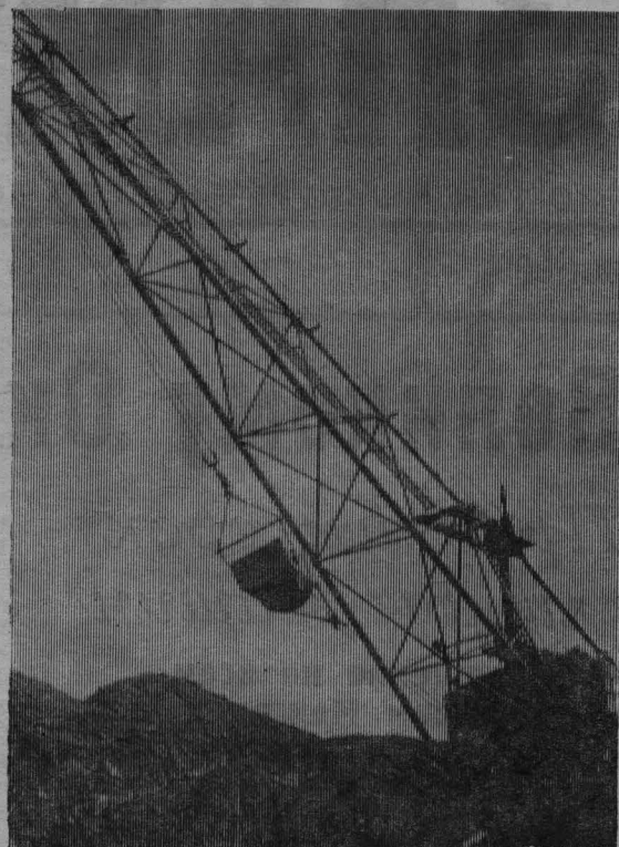
Новый шагающий великан пришел на разрез «Томусинский-3-4». Вместимость его ковша — 10 кубометров.

Одно рационализаторское предложение дает около 100 тыс. рублей экономии! Это предложение внес помощник начальника 1 участка Семен