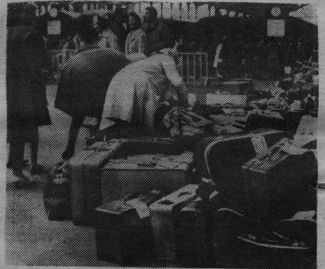
ФРАНЦИЯ. Париж. На вокзале Сен-Лазар во время забастовки железнодорожников.