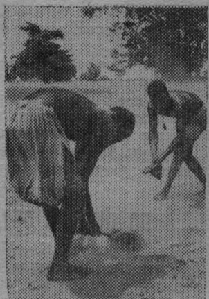
В Гвинейской Республике

крестьяне обрабатывают поля пока еще очень примитивным способом. Но в ближайшем времени у них будут тракторы, плуги, бороны. За год в стране создано 2-440 коллективных полей и около 70 коллективных плантаций.